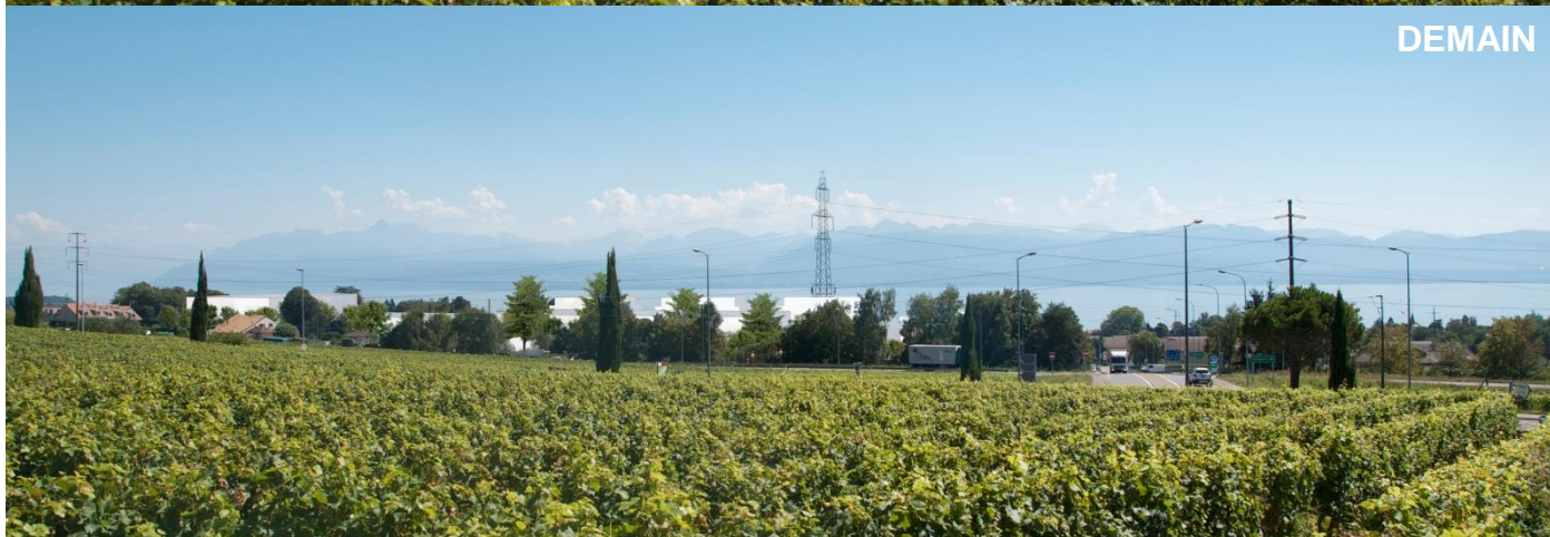
Vue depuis l'intersection route de l'Etraz-chemin de Jolimont